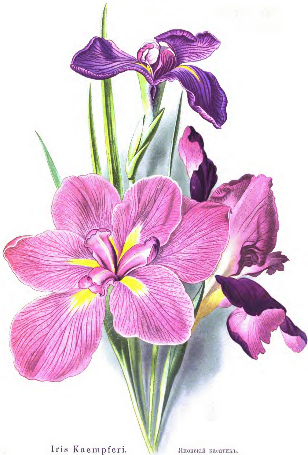
Iris Kaempferi.

Японскій касатикъ.